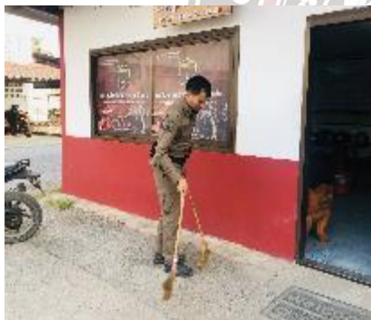
ทำความสะอาดบริเวณห้องปฏิบัติการ สายตรวจ