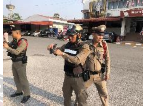
มีการตรวจอุปกรณ์ประจำกาย รวมถึงซ้อมยุทธวิธีก่อนออกปฏิบัติหน้าที่ทุกครั้ง