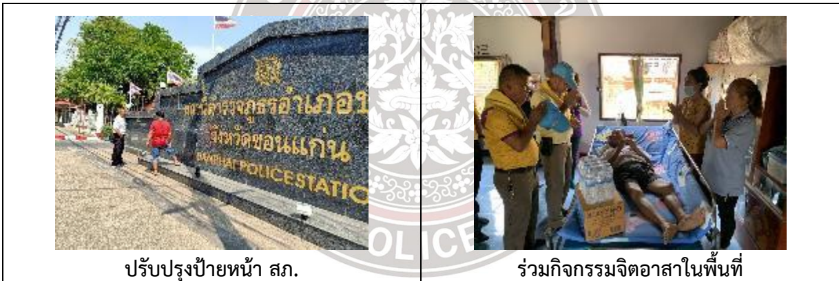
ปรับปรุงป้ายหน้า สภ.