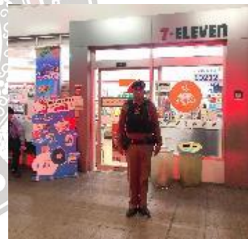
ออกตรวจสถานที่เสี่ยง