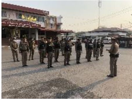
มีการประชุมชี้แจงก่อนออกปฏิบัติหน้าที่ทุกครั้ง

มีการจับกุม คดีเสพยาเสพติด คนคลุ้มคลั่ง รวมถึงอาชญากรรมต่าง ๆ