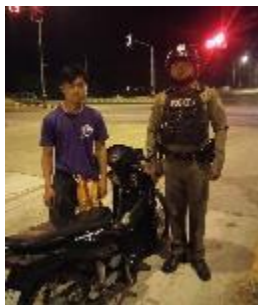
ออกตรวจภายในเขตพื้นที่รับผิดชอบ