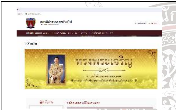
ประชาชนสามารถตรวจสอบผลการปฏิบัติงาน และประเมินความโปร่งใสของสภ.บ้านไผ่ ได้ ณ ที่หน้าเว็บไซต์ของ สภ.

งานอำนวยการ ได้ดำเนินการตามโครงการต่าง ๆ ที่ผู้บังคับบัญชามอบหมาย เช่น โครงการอาหารกลางวัน , โครงการพัฒนาสุขภาพข้าราชการตำรวจ (เล่นกีฬาฟุตบอล) , โครงการทำความสะอาดตามกิจกรรม ๕ ส. , โครงการตำรวจดีเด่น เป็นต้น การประชาสัมพันธ์ข้อมูลข่าวสารการปฏิบัติงานต่าง ๆ ของสถานี การตรวจสอบสภาพการเงินและปัญหาหนี้สินของข้าราชการตำรวจ สภ.บ้านไผ่ รวมถึงหาแนวทางการแก้ไข การเปิดเผยให้ประชาชนตรวจสอบ และประเมิน ความโปร่งใสในการปฏิบัติงานของ สภ.บ้านไผ่ การพัฒนาแหล่งที่อยู่อาศัยตามโครงการบ้านพักน่าวอยู่ การเรียกตรวจสอบสภาพทรัพย์สินของทางราชการที่มีการเบิกยืมไป