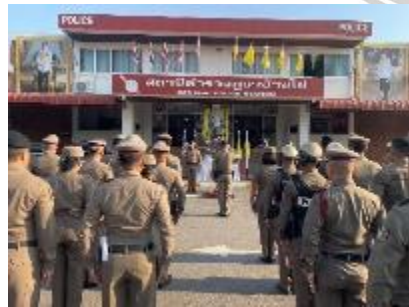
ข้าราชการตำรวจเข้าแถวเคารพธงชาติ สวดมนต์ ท้องบทปลงใจ อุดมคติตำรวจ ผู้บังคับบัญชา ตรวจการแต่งกาย ตรวจทรงผม กำชับการประพฤติตนแก่ข้าราชการตำรวจ