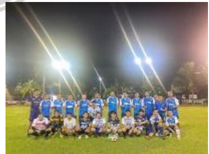
โครงการเตะฟุตบอล เพื่อส่งเสริมสุขภาพข้าราชการตำรวจ