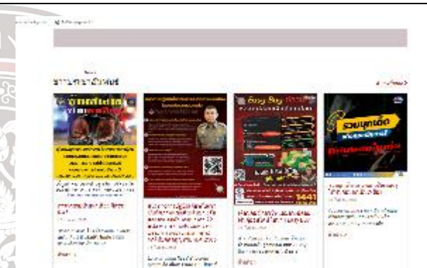
มีการประชาสัมพันธ์การปฏิบัติงานภายในหน่วย และข้อมูลกฎหมาย รวมถึงช่องทางการร้องเรียนร้องทุกข์ ให้ประชาชนรับทราบ