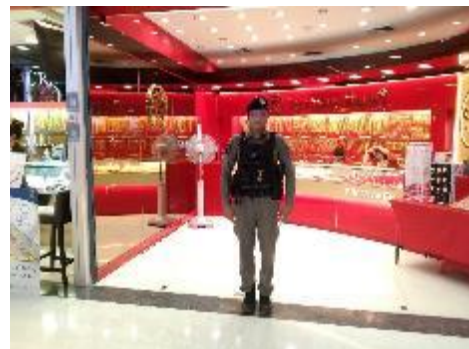
ออกตรวจสถานที่เสี่ยง