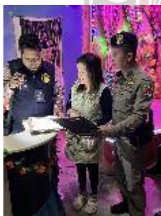
ออกตรวจภายในเขตพื้นที่รับผิดชอบ