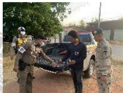
ผลงานด้านการป้องกันปราบปราม