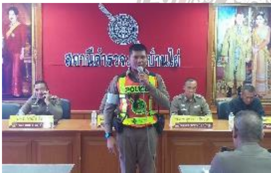
รายงานตัวข้าราชการที่เดินทางมารับตำแหน่งใหม่ ณ สภ.บ้านไผ่

ได้ดำเนินการตามโครงการต่าง ๆ ที่ผู้บังคับบัญชามอบหมาย เช่น โครงการอาหารกลางวัน , โครงการพัฒนาสุขภาพข้าราชการตำรวจ (เล่นกีฬาฟุตบอล) , โครงการทำความสะอาดตามกิจกรรม ๕ ส. , โครงการตำรวจดีเด่น เป็นต้น การประชาสัมพันธ์ข้อมูลข่าวสารการปฏิบัติงานต่าง ๆ ของสถานี การตรวจสอบสภาพการเงินและปัญหาหนี้สินของข้าราชการตำรวจ สภ.บ้านไผ่ รวมถึงหาแนวทางการแก้ไข การเปิดเผย ให้ประชาชนตรวจสอบ และประเมิน ความโปร่งใสในการปฏิบัติงานของ สภ.บ้านไผ่ การพัฒนาแหล่งที่อยู่อาศัยตามโครงการบ้านพักนอากู่ การเรียกตรวจสอบสภาพทรัพย์สินของทางราชการที่มีการเบิกยืมไป