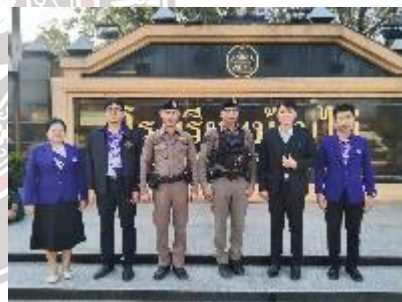
ออกตรวจสถานที่เสี่ยง