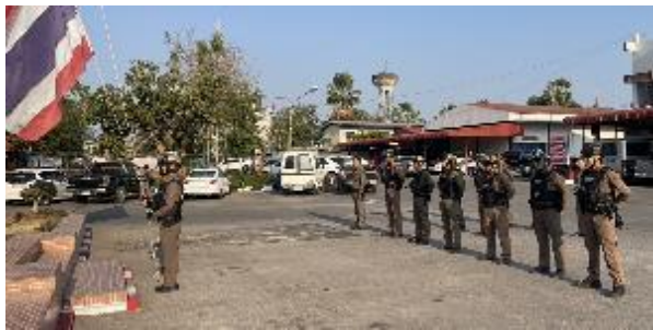
มีการประชุมชี้แจงก่อนออกปฏิบัติหน้าที่ทุกครั้ง