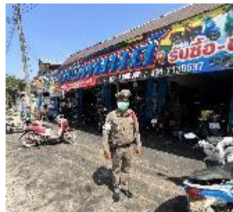
ผลงานด้านการป้องกันปราบปราม