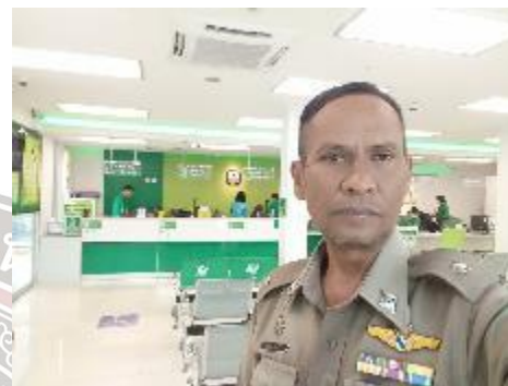
ออกตรวจสถานที่เสี่ยง