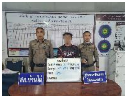
ผลงานด้านการจับกุม