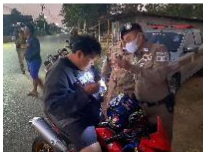
ผลงานด้านการป้องกันปราบปราม