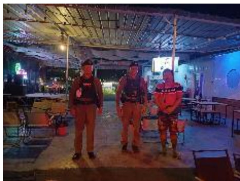
การตรวจสถานบริการ