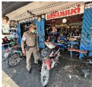
ผลงานด้านการป้องกันปราบปราม

งานจราจร มีการป้องกันปราบปราม บูรณาการร่วมสายงานอื่น กวดขัน จับกุมความผิดต่าง ๆ เช่น ยาเสพติด, ดัดแปลงสภาพรถ, ขับรถขณะเมาสุราหรือของมีเมาอย่างอื่น, ไม่สวมหมวกนิรภัย เป็นต้น