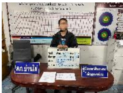
ผลงานด้านการจับกุม