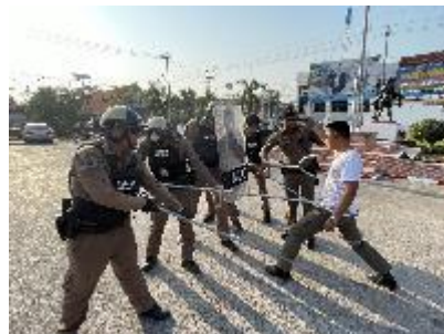
มีการตรวจอุปกรณ์ประจำกาย รวมถึงซ้อมยุทธวิธีก่อนออกปฏิบัติหน้าที่ทุกครั้ง