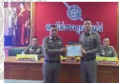
พ.ต.อ.ปรัชญามาศ ไชยสุระ ผกก.สภ.บ้านไผ่ มอบใบประกาศนียบัตรแก่ข้าราชการตำรวจผู้ปฏิบัติหน้าที่ดีเด่นในแต่ละสายงาน เพื่อเป็นขวัญและกำลังใจในการปฏิบัติหน้าที่ต่อไป